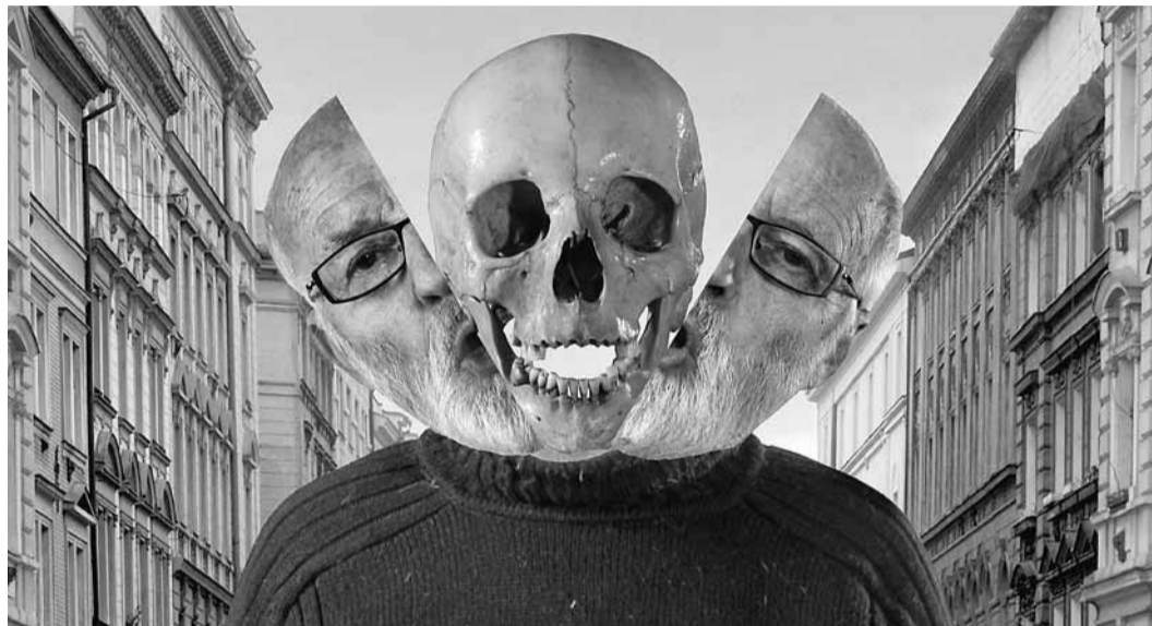
Režisér Jan Švankmajer v úvode svojho filmu Prežiť svoj život .

– Skutočne, začiatok filmu je až do prebudenia môj autentický sen. Keď som sa totiž prebudil, hovoril som si, že to vyzerať ako začiatok nejakého filmu. A tak sa aj stalo. Sny sú ale rôzne. Niektoré sú naliehavejšie než druhé. Vieme, že nevedomie, ktoré prostredníctvom nich s nami komunikuje, nám